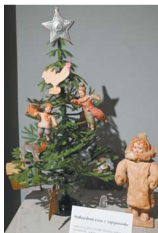
Несмотря на обстоятельства, в детских садах встречали новый, 1942 год

детских садов работало в Ленинграде зимой 1941–1942 годов. Их посещали около 30 тыс. малышей