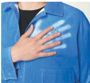
Ткань рубашки меняет цвет от лёгкого прикосновения ладонью

– Я подумал, это забавная идея: рыба изменяет окраску, чтобы остаться незамеченной для добычи и хищников, а одежда с такими же свойствами позволит человеку, наоборот, выделиться, выглядеть ярче и нестандартно. Ничего подобного в России я не встречал... А в 2022 году получил грант на форуме «Амур» в размере 50 тыс. рублей и уже знал, во что вло-