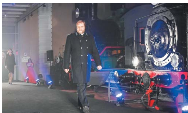
Ретроформа вагоновожатого петербургского трамвая дореволюционной России