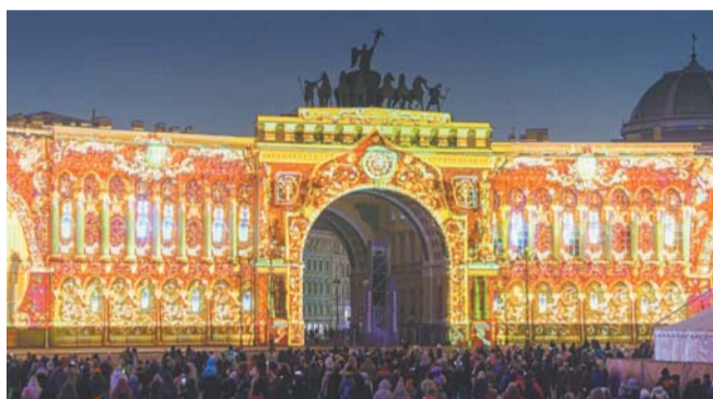
Фасады превратятся в экраны | ТЕЛЕГРАМ-КАНАЛ @ПИОТРОВСКИЙ ONLINE