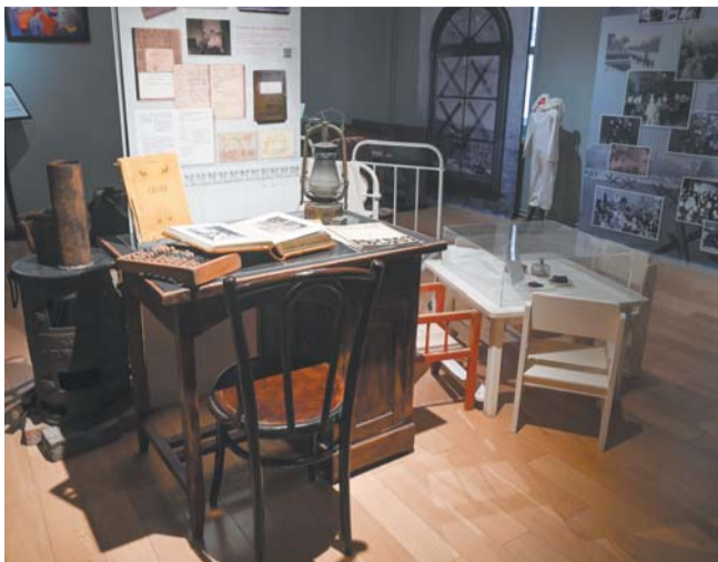
В музейном зале воссоздано помещение группы и бомбоубежище, где ночевали дети