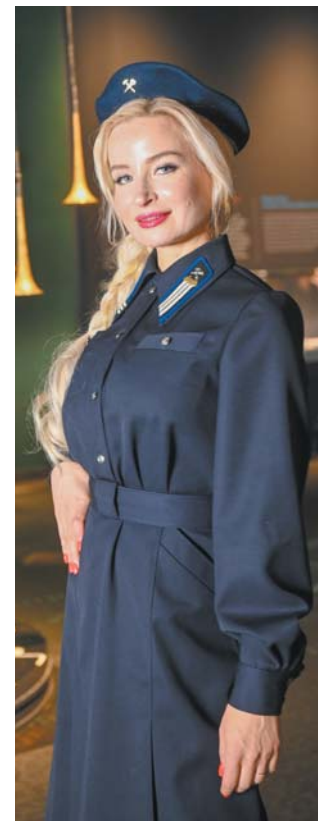
Женская форма машинистов метрополитена 1955 года