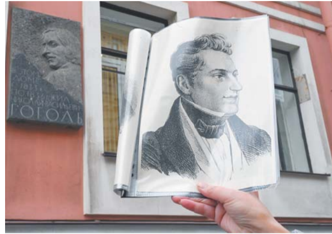
Портрет Гоголя с разницей в 10 лет. На листе А4 Николай Васильевич в молодости

Впрочем, Гоголь не был пристрастен к горячительным напиткам, чего не ска-