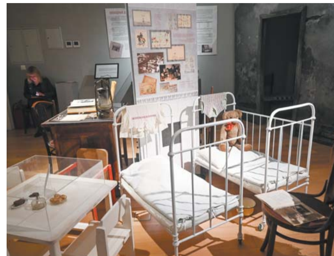
Измученные голодом дети могли думать и говорить только о еде. Воспитатели старались отвлекать их играми и песнями