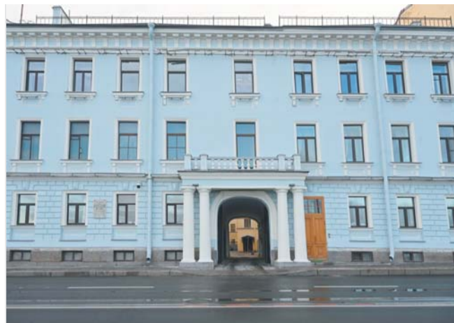
Лицевые и дворовые фасады дома Кутузова обрели первозданный вид