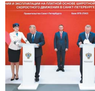
Подписание соглашения | GOV.SPB.RU

Стоимость строительства 2–4-го этапов магистрали составит порядка 241 млрд рублей. METRO