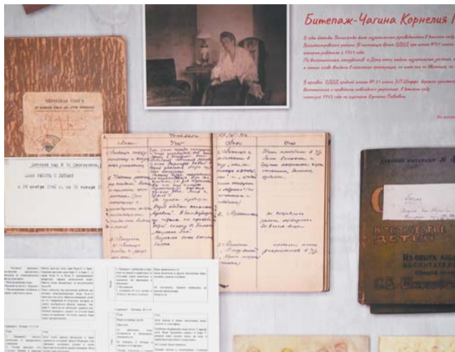
На выставке можно увидеть записи блокадных воспитателей