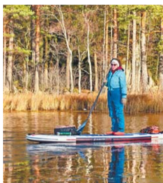
Автор: Светлана Вид спорта: сап Режим: по сезону

Неважно, спорт это или просто движ, но в форме надо быть постоянно. Я на сапе уже 5 лет. Везде и всюду, где есть вода, беру его с собой. Для меня этот вид спорта – образ жизни. Ладожские и Кижские шхеры, реки Ленинградской области и Подмосковья, даже Башкирии, на море – тоже. Для этих спортивных активностей любое время года подходит. Пока вода не замёрзла, сезон не закрыт.