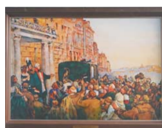
Картина в парадном доме Кутузова. На ней сцена 1812 года: люди провожают полководца с порога этого дома на фронт

– Подрядная организация приложила максимум усилий для того, чтобы придать классическому зданию тот лоск, который всегда суще-