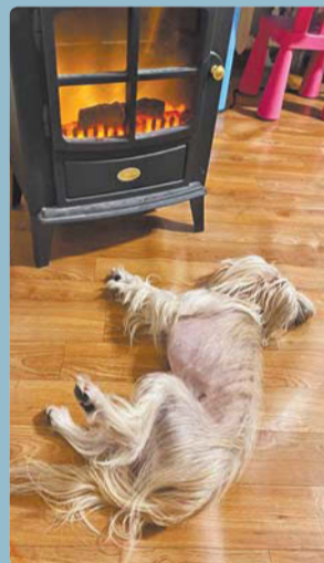
«После сытного обеда по закону Архимеда полагается поспать», – Боня, законопослушный пёсик.