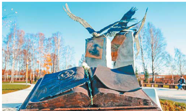
Скульптурная композиция «Журавли» и раскрытая книга с портретом Расула Гамзатова, его автографом и символическим пером