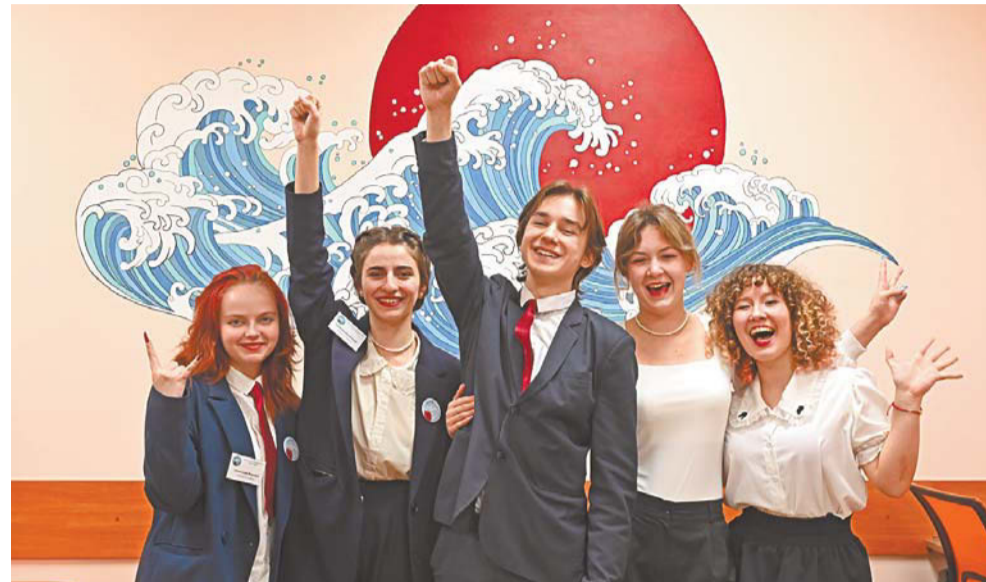
Команда школы №83 с самого начала верила в свою победу

В процессе школьники повышают финансовую и бюджетную грамотность, развивают навыки работы в команде и лидерства, презентации и публичного выступления.