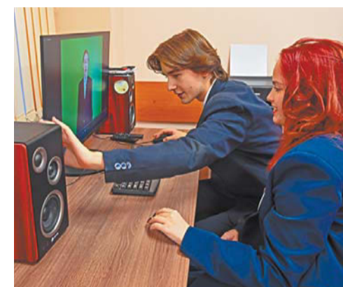
Ребята с удовольствием пробуют себя в роли блогеров, операторов и монтажёров