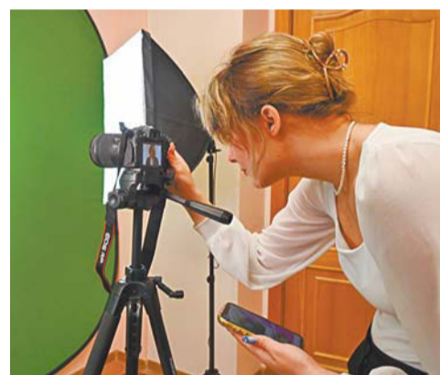
Мультистудия TSURU открылась совсем недавно, 19 ноября, но уже пользуется большой популярностью