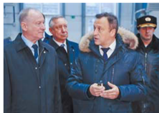
По словам Патрушева, работа центра – это один из основополагающих элементов развития судостроительной отрасли

Губернатор Александр Беглов и помощник Президента России, председатель Морской коллегии Николай Патрушев посетили Крыловский государственный научный центр. Глава города подчеркнул, что здесь проходят испытания практически все наши корабли. Патрушев отметил, что центр обеспечит создание мощного Военно-морского флота. METRO