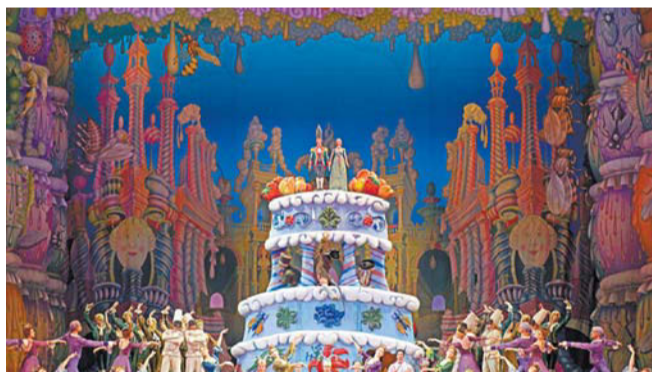
«Щелкунчик»

Трагикомедия по пьесе Флориана Зеллера в ДК «Выборгский». В ролях – Сергей Маковецкий и Марина Александрова. Главному герою пьесы Андрэ 80 лет, когда-то давно он был танцовщиком. Герой