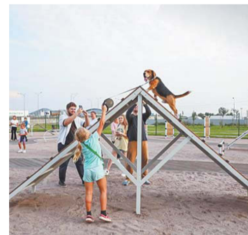
Площадка для выгула и дрессировки собак: Витебский проспект, 101