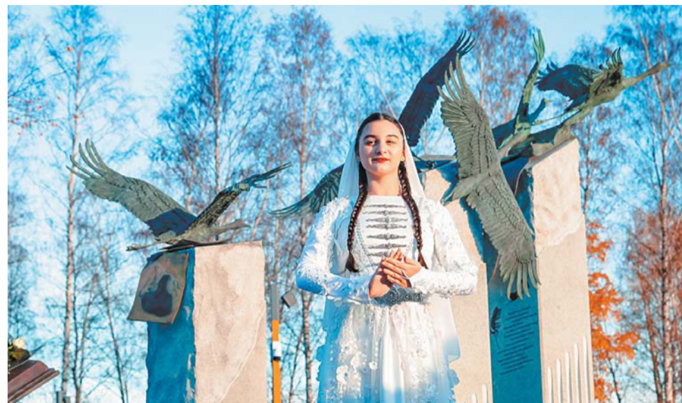
Сквер Расула Гамзатова