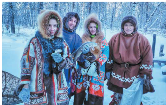
Зимняя рыбалка при температуре –19 градусов. Речку посреди леса ханты перегораживают жердями и опускают в воду деревянную «клетку», куда собирается рыба. Остаётся только пробить лёд и достать добычу