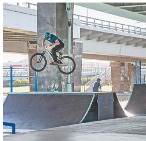
Скейт-площадка на пересечении Пулковского шоссе и Дунайского проспекта

Губернатор пообещал, что работы по благоустройству города остаются в приоритете и будут продолжены.