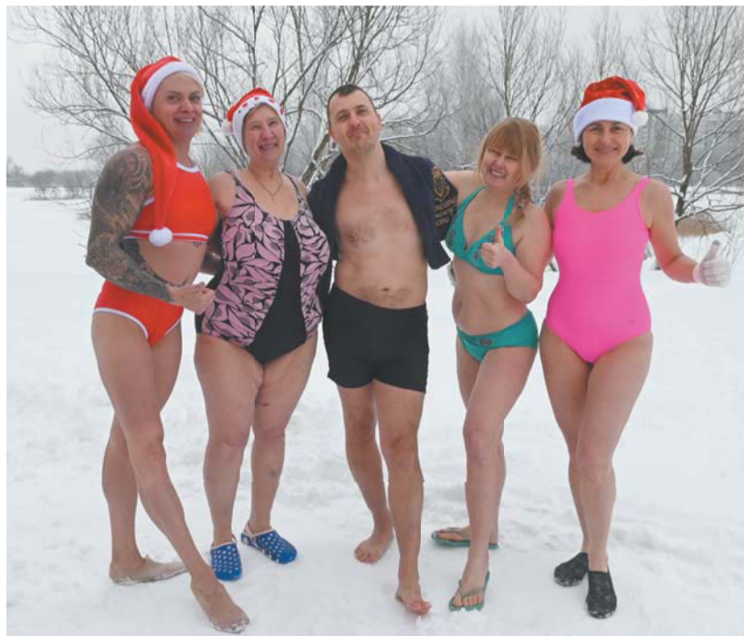
Моржи из Купчино не ждут Крещения, а окунаются в прорубь с первыми заморозками