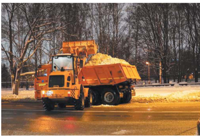
Петербург убирают и днём и ночью