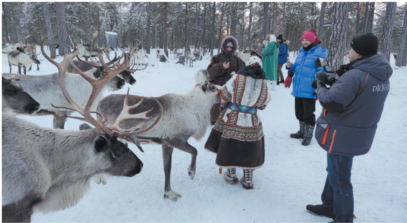
«Общение» с оленями – одно из самых ярких впечатлений поездки

В каждом из крупнейших городов ХМАО есть своя фишка. Благоустройство Когалы-