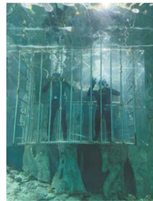
Наше погружение в океариуме

В Югре стоит ехать не в музей, а за зимними активностями. В Сургуте мы поката-