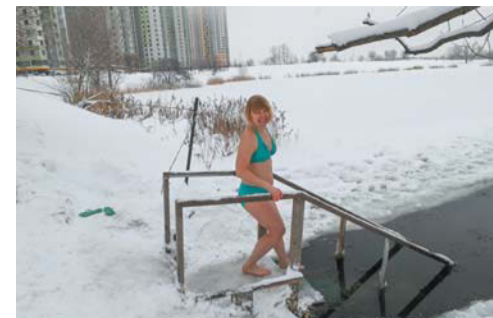
В прорубь нужно входить постепенно и следить за дыханием. Главное тут – суметь расслабиться