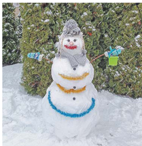
Вот такого нарядного снеговика прислала наша читательница Лариса Ягодкина