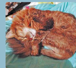
«Фима спит, она устала».