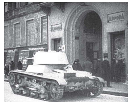
Кинотеатр «Аврора» в годы блокады

стрела. Зрителей переводили в бомбоубежище. Когда же по радио раздавалась команда «Отбой воздушной тревоги», люди возвращались в зал.