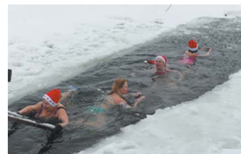
Оптимальное время для погружения в холодную воду – 5–10 секунд