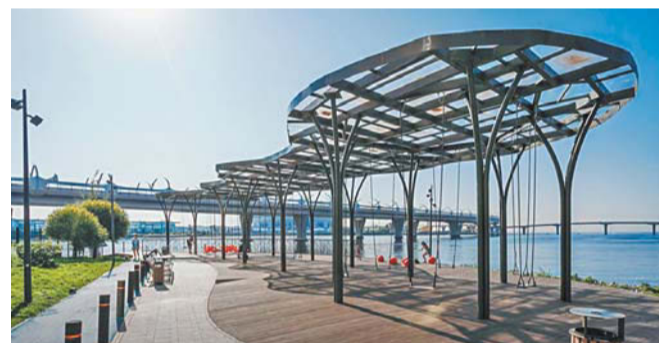
Набережная Большой Невки от 3-го Елагина моста до парка 300-летия Санкт-Петербурга

ста в различных номинациях премии АЛАРОС-2024.