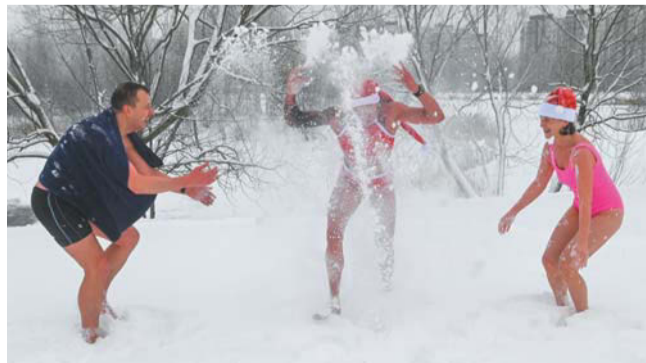
Перед тем как нырять в прорубь, моржи проводят короткую разминку

В крещенские купания моржи из Купчино планируют окунуться ранним утром в проруби в Петергофе.