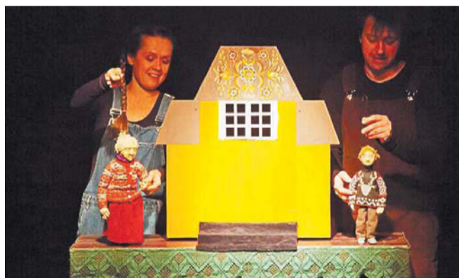
«Вафельное сердце»

Спектакль по мотивам одноимённой повести Марии Парр в театре «КУКФО». Забавные, трогательные, а зачастую очень опасные приключения двух жителей норвежской деревушки в бухте Щепки-Матильды – девятилетнего Трилле и его соседки и одноклассницы Лены. История о грустном и смешном, о самом важном и мелочах, о настоящей дружбе и любви, о творчестве, фантазии и о том, что ничего на свете не надо бояться, особенно когда у тебя есть верный друг.