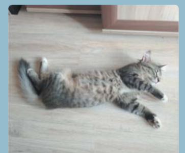
«Котик Семушка спит без задних лап», – хозяйка Светлана.