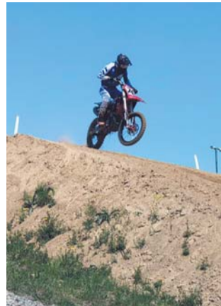
Направление мотоспорта эндуро – это езда по лесам, полям и бездорожью

– Мотоспорт полностью отвечает основным задачам физической подготовки подрастающего поколения. Как сказал один капитан: «Если едешь на мотоцикле, с вестибулярным аппаратом всё в порядке, морской болезни у тебя точно нет, отправляйся в кругосветку!» –