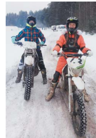
Владельцы мотоциклов эндуро меняют летнюю резину на зимнюю и катаются по снегу

сты поддерживают друг друга в мастерской, в пути. Мы – это одна большая, дружная семья!