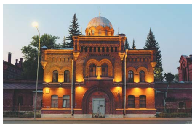
Своё название тюрьма получила благодаря ансамблю зданий, напоминающих четырёхконечные кресты