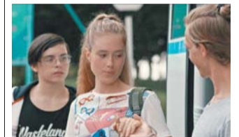
КАДР ИЗ СЕРИАЛА «ЛЕГЕНДЫ «ОРЛЕНКА»