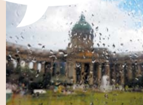
Фото и текст: читательница Metro Ольга