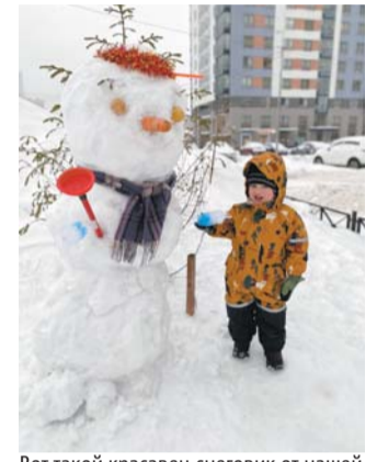
Вот такой красавец-снеговик от нашей читательницы Ольги.