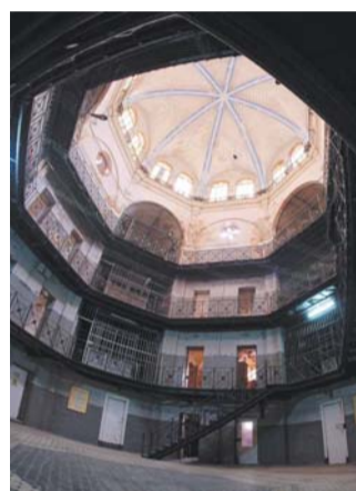
«Кресты» были самой передовой тюрьмой в конце XIX века

Имелись свет, тепло и вода «Кресты» были построены в 1884–1892 годах. Исправительное учреждение стало самым крупным и одним из самых современных в Европе. В нём были электричество, вентиляция, отопление и водоснабжение.