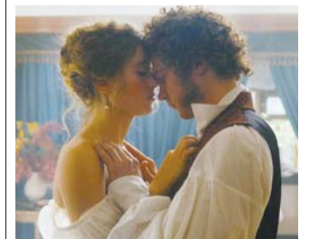
КАДР ИЗ ФИЛЬМА «ПРОРОК. ИСТОРИЯ АЛЕКСАНДРА ПУШКИНА»

Из ближайших проектов – второй сезон триллера «Фишер». Также актриса утверждена на главную роль в картине «Руслан и Людмила».