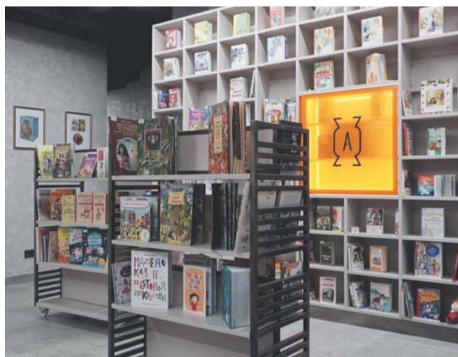
Залы в библиотеке – это «цеха» | СОЦСЕТИ БИБЛИОТЕКИ