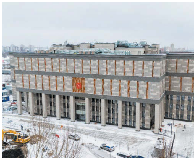
В новом архивном комплексе на Заневском проспекте, 54, корп. 1, будут два читальных зала для работы с подлинными документами. Это решит проблему с очередью, которая существует сегодня

«Вклад архивистов в сохранение исторической памяти сложно переоценить. В том числе благодаря их работе удалось добиться признания блокады Ленинграда геноцидом», – рассказал губернатор Санкт-Петербурга Александр Беглов в своём телеграм-канале. METRO