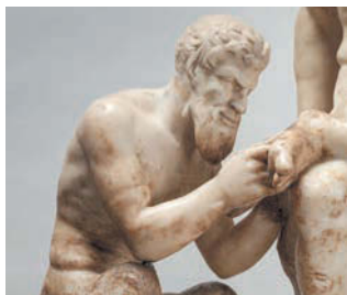
Пан и сатир. Мрамор, III век до н.э., Рим | ЭРМИТАЖ

Откуда бы ни вёл своё происхождение монстр, они все могут честно смотреть людям в глаза: только дай шанс! Они вас цапают, уволокут и схряпают.