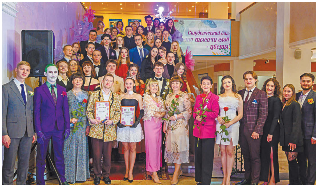
СПбГУП формирует собственную яркую культурную жизнь. В центре (с дипломами) Король и Королева студенческого бала – 2025