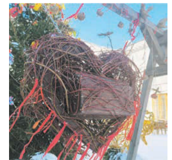
Посетители парка могут отправить в сердце чучела записки с негативными эмоциями

В Екатерининском соборе 1 марта состоится панида «Утёши на блинах». Там выступят артисты «Петербург-концерта». В концертном зале Мемориального музея-квартиры Пушкина 2 марта прозвучат русские народные песни и композиции Чайковского, Мусоргского и др. Необычная «МотоМасленица» пройдёт на Пискаревском проспекте, 144 АК. Юные посетители смогут прокатиться на байке. ЮЛИЯ ЖУРАВЛЁВА