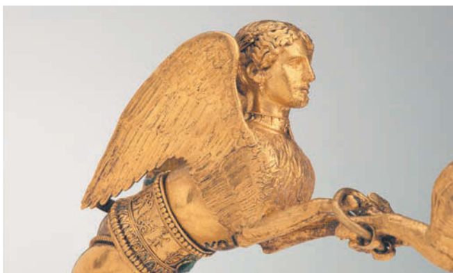
Браслет со сфинксами. Золото, IV век до н.э. | ЭРМИТАЖ