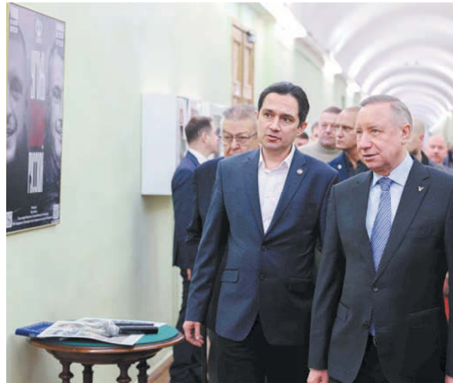
Губернатор принял участие в открытии выставок | GOV.SPB.RU

— Зима не уйдёт, болезни останутся. Главная идея Масленицы — обновление и перерождение, — добавляет эксперт.