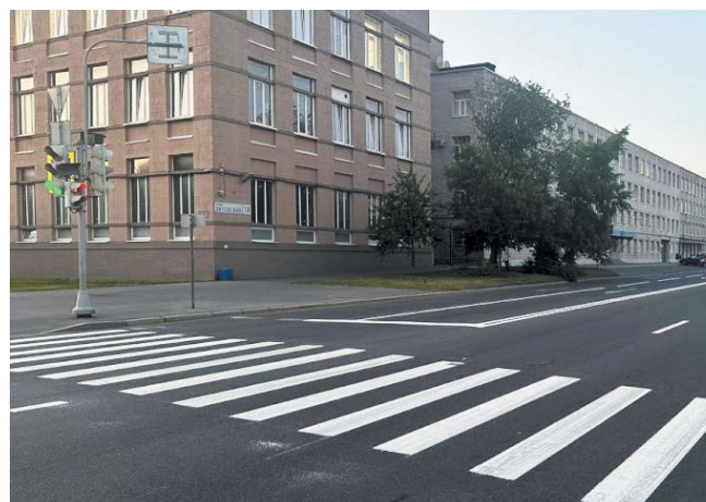
Петербург присоединился к реализации федерального проекта «Общесистемные меры развития дорожного хозяйства» в рамках национального проекта «Инфраструктура для жизни» | GOV.SPБ.RU

млн рублей получит бюджет Северной столицы в 2025 году, в 2026 году – 109 млн рублей, в 2027-м – 94,5 млн рублей