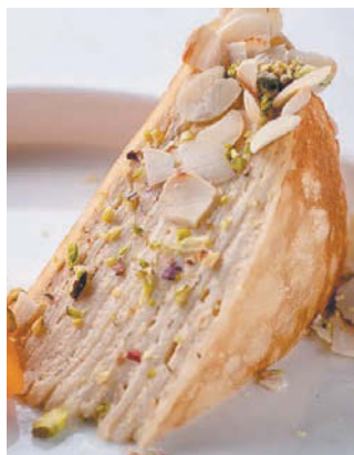
Попробуйте приготовить блины от шефа у себя дома