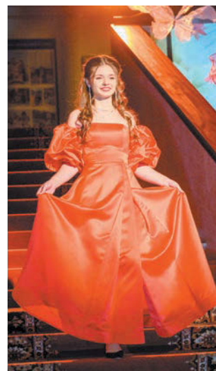
Участники бала до мелочей продумывают свой образ. Девушки – в красивых роскошных платьях

одна из структур студенческого самоуправления Санкт-Петербургского Гуманитарного университета профсоюзов. Он отвечает за организацию досуга, причём главной своей задачей ста-