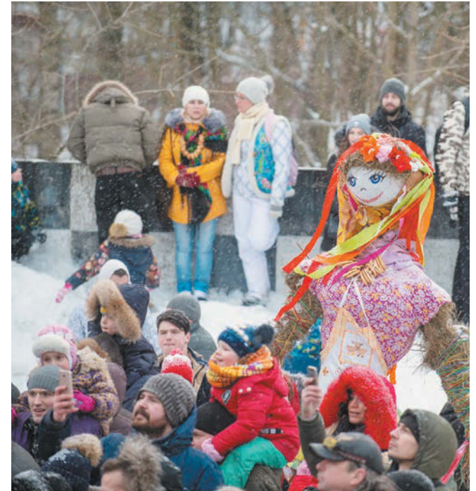
Масленичными гуляньями люди провожают не только зиму, но и болезни, и всё старое, отжившее

— В Сибири с икрой и сёмгой делали, на Алтае — с мороженой строганиной и