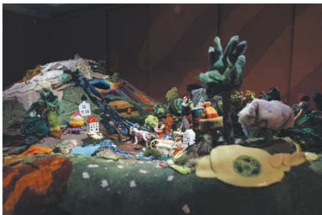
МУЗЕЙ ТЕАТРАЛЬНОГО И МУЗЫКАЛЬНОГО ИСКУССТВА