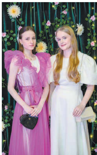
Бал – мероприятие, на котором хоть раз в жизни мечтает побывать каждая девушка