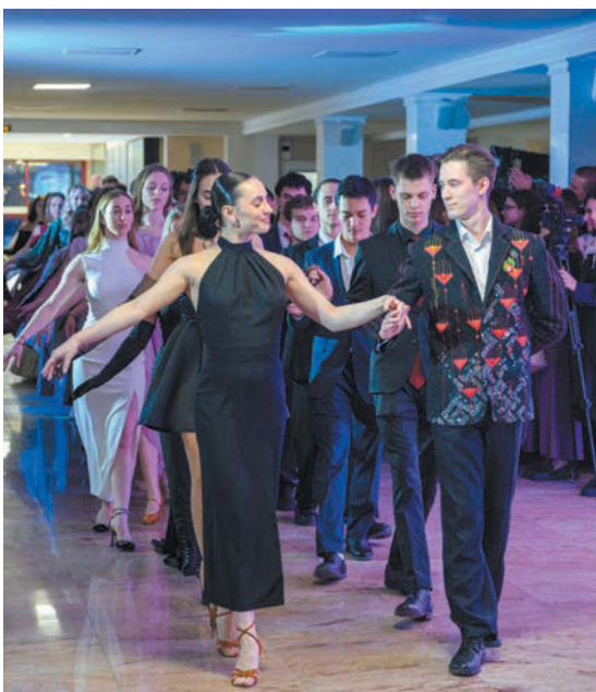
Главное на балу – это танцы. Поэтому студенты кафедры хореографии за несколько недель до праздника проводят мастер-классы для коллег, обучающихся на других специальностях