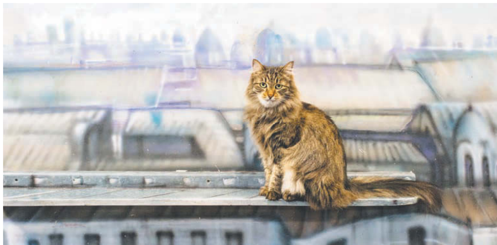
Штрудель к работе над новым проектом готов

Для формирования базы данных предусмотрено два пути. Первый — официальный. Сотрудники музея и пространства «Республика кошек» будут отправлять запросы