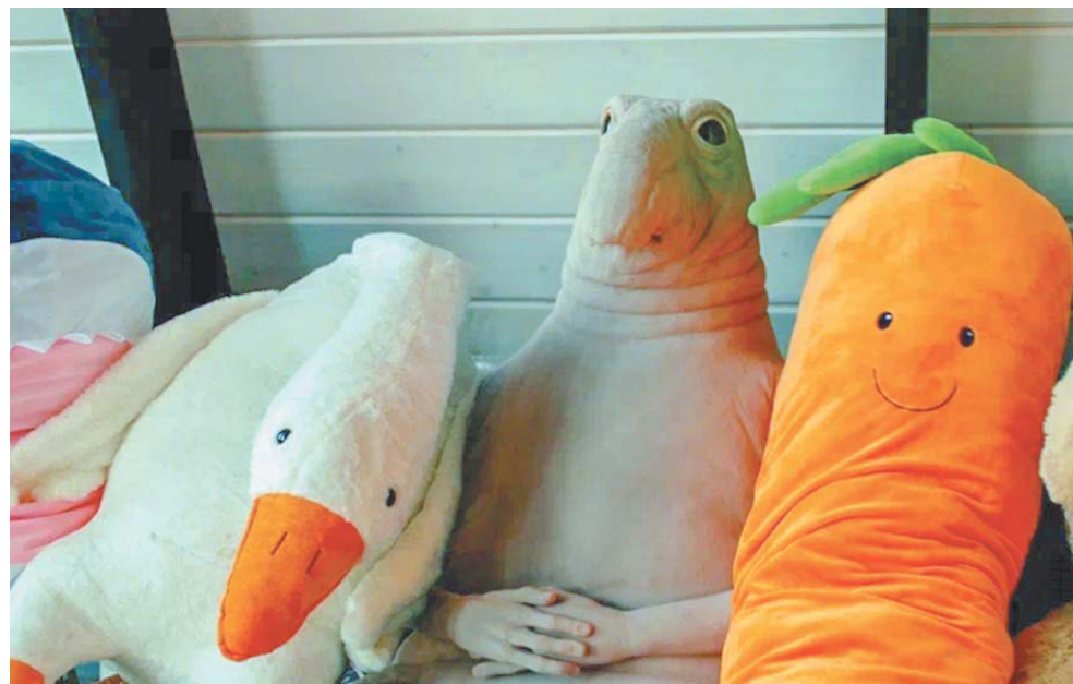
Семья Семёновых объединится, чтобы помочь Ждуну

– Большую часть времени мы потратили на компьютерную