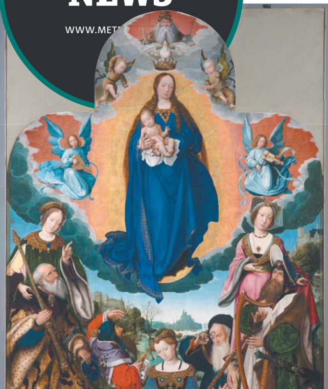
Картину нашли за фальшстеной в соборе в Брюгге