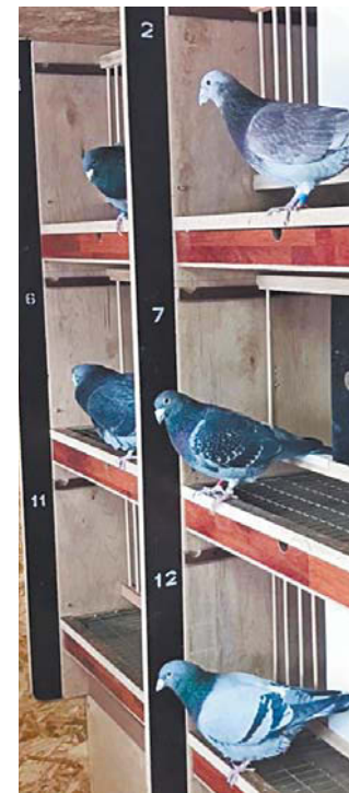
Спортивные голуби в питомнике. С нетерпением ждут начала тренировок и соревнований

летают на дистанции от 190 до 720 километров.