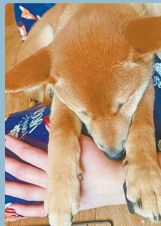
«У Ричи самое удобное место для сна — хозяйин», — хояйка Виктория.