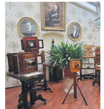
Студия располагается по соседству с Музеем Карла Буллы. В нём можно многое узнать об истории не только Петербурга, но и всей страны