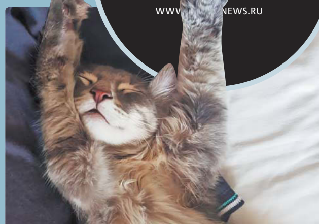
«Это американский кёрл Йогурт, спит после поскоакушек», — пишет Светлана.