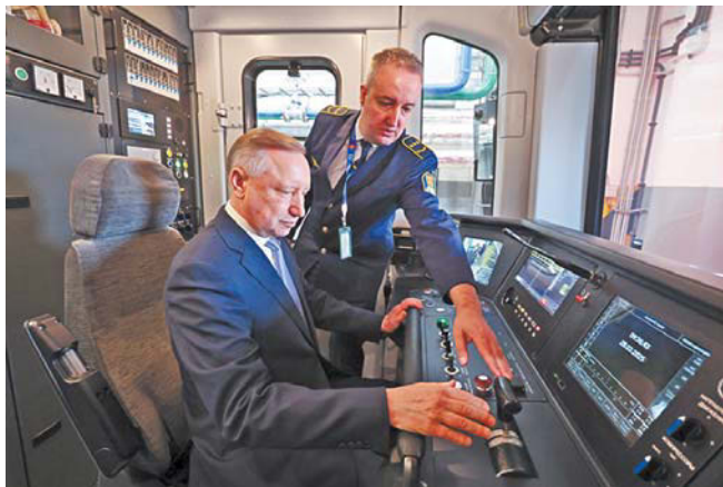
Александр Беглов осматривает юбилейный состав «Балтиец»

О том, что совсем скоро красную ветку будут обслуживать только новые метропоезда, рассказал в ходе рабочего совещания губернатор Северной столицы Александр Беглов.