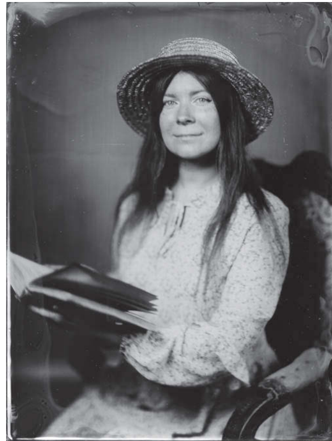
У нас получился такой портрет

Как я уже говорила, очень важно верно выбрать позу. По сути, на каждый снимок всего одна попытка. Моргать можно, а вот шевелиться