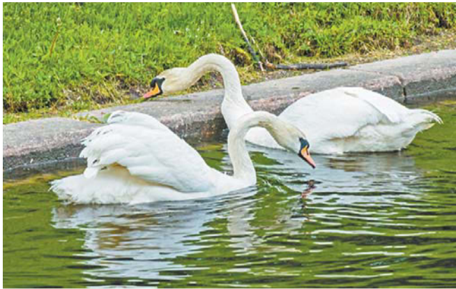
Елисей и Любава в 2026 году могут стать родителями | АЛЁНА БОБРОВИЧ

Чувствительны лебеди и к капризам погоды.