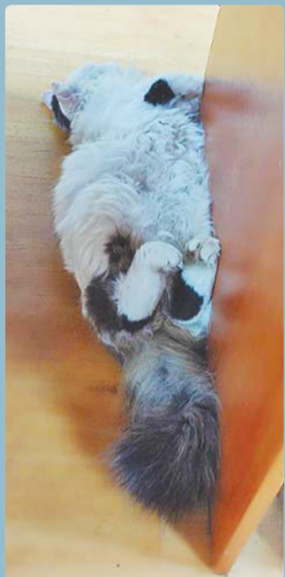
«Присылаю вам прекрасную охотницу Ньюшу», – хозяин Ростислав.