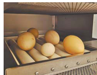
Чтобы уберечь будущих птенцов от хищников, яйца лебедей уносят в инкубатор | ЛЕНИНГРАДСКИЙ ЗООПАРК

– Птицы в целом склонны к моногамии. Даже серые вороны из года в год находятся в одной и той же паре. Но иногда случается, что сложившаяся пара может в какой-то момент разойтись и найти других партнёров. Такое не часто, но бывает.