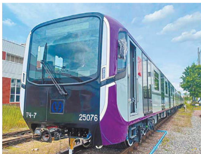
Интерьер и экстерьер нового «Балтийца-2» выдержаны в фиолетовой цветовой гамме, соответствующей цвету 5-й линии