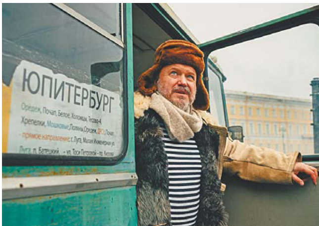
Зрители увидят Петербург будущего

Русские традиции интересно переплетаются с будущим в сериале