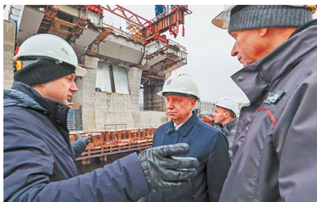
Губернатор осмотрел ход строительства Большого Смоленского моста | GOV.SPB.RU