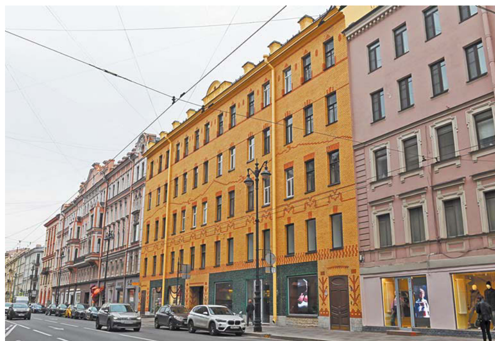
Лицевой и дворовый фасады бывшего доходного дома восстановили