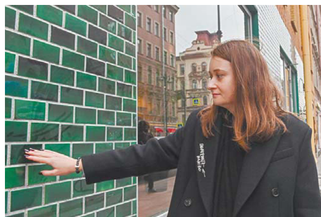
Зелёная плитка «кабанчик» воссоздана по архивным документам

но такую плитку. Вариантов было много, но ничего не подходило. Наконец, нашлись люди, которые справились. Они делали обжиг материала при температуре около 1000 градусов. Отсюда получились такая структура и цвет.