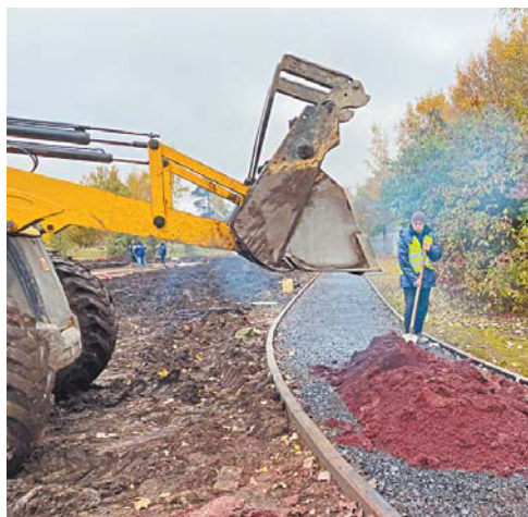
Аромат клубники асфальт источает, пока не высохнет. «Парфюм» для асфальта ещё бывает персиковый и ванильный