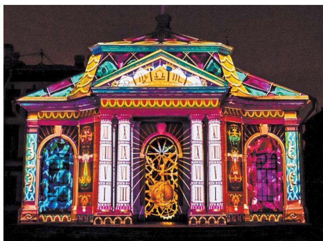
Видеопроекции, которые показывали в Петропавловской крепости в прошлом году | СОЦСЕТИ ФЕСТИВАЛЯ