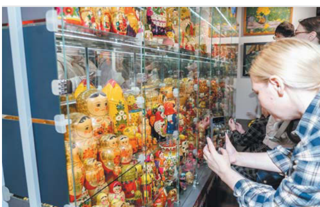
Выставка открыта до 20 января 2026 года

— Есть матрёшка, созданная в ковид, – коронавирус вплетён в орнамент платка и рукава, – добавляет собеседница Metro.