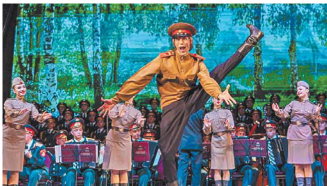
Гастроли ансамбля А.В. Александрова

Лучшие мировые рок-хиты последних десятилетий в исполнении ярких музыкантов прозвучат в Петербурге. На сцене «Коллизей Арены» струнный Crush String Quartet выступит в сопровождении мощных ударных. Таких энергичных струнных вы ещё не слышали!