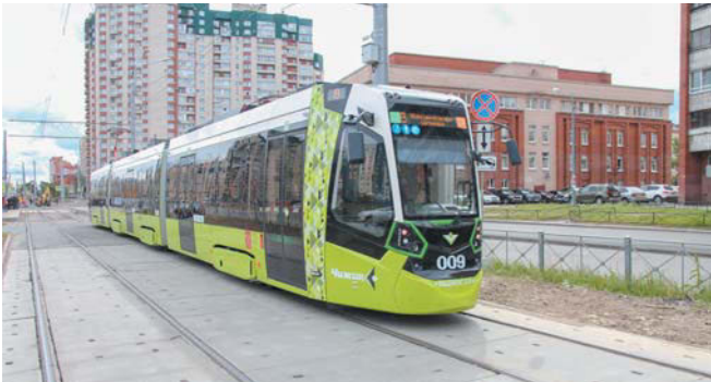
Мировой опыт показывает, что у вместительного, быстрого и экономичного вида транспорта большое будущее. На фото трамвай «Чижик»

Какие наиболее амбициозные проекты меняют транспортную систему города? – Сразу на ум приходит «Чижик». Это первый в России проект государственно-част-