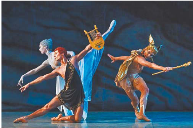
Балет «Орфей»

Концертный хор «Перезвоны» под управлением Ларисы Яруцкой – неизменный участник фестиваля «Земля детей». В этом году под сводами евангелическо-лютеранской церкви Святой Марии в исполнении