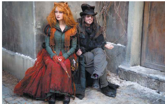
Кадр из фильма «Буратино»