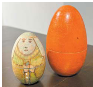
Одна из самых старинных матрёшек