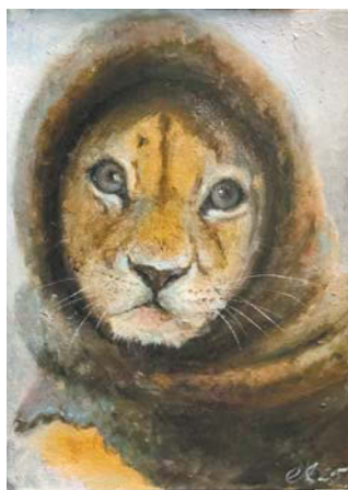
Львёнок (собирательный образ)