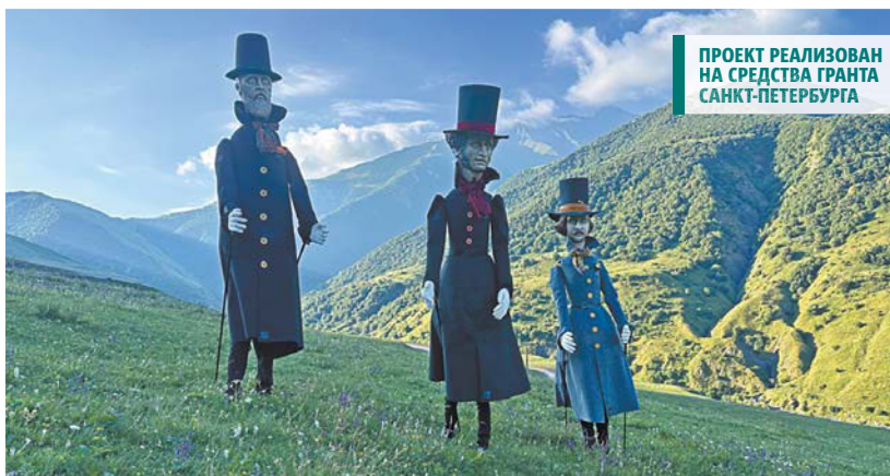
Великаны Достоевский, Пушкин и Гоголь во время съёмки в Северной Осетии

На улицах Петербурга великаны появились десять лет назад. На празднике День Достоевского появились куклы,