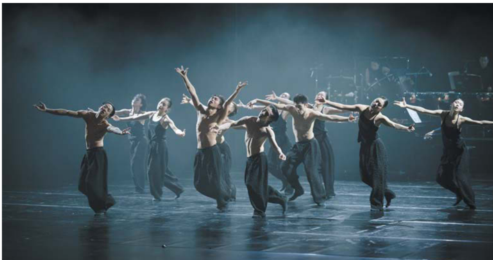
«Сати / Весна священная»