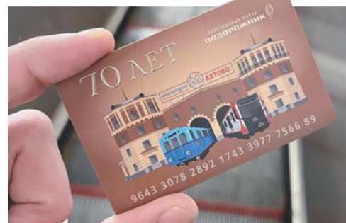
«Подорожник» к юбилею метрополитена