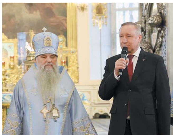
Глава Северной столицы подчеркнул, что Казанскую икону особо почитал основатель Петербурга Пётр Первый