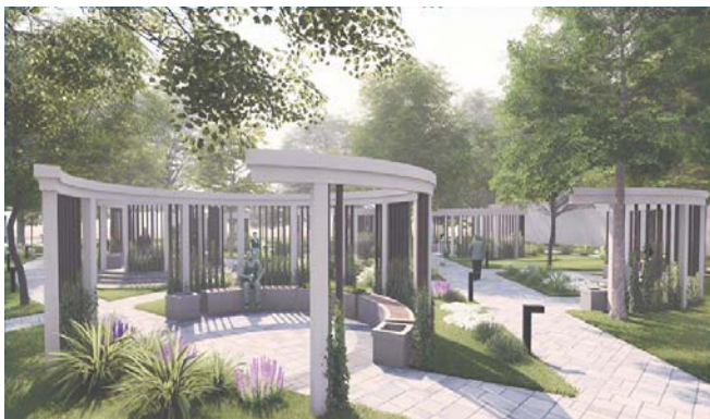
Так будет выглядеть Карпатский сквер во Фрунзенском районе после благоустройства. Работы должны быть завершены в 2026 году

ПРОЕКТ РЕАЛИЗОВАН НА СРЕДСТВА ГРАНТА САНКТ-ПЕТЕРБУРГА