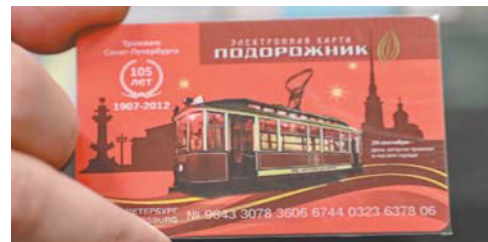
Первый коллекционный «Подорожник». Его выпустили ко дню рождения трамвая