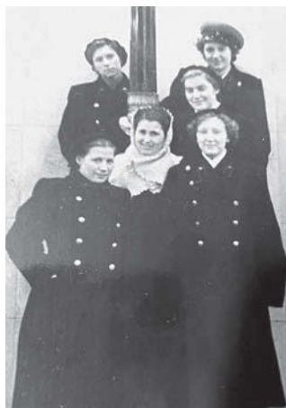
С коллегами на станции «Технологический институт»

ся. Очень меня разозлил! Разное случалось. В метро нельзя было провозить животных, но некоторые несознательные пассажиры нарушали это правило. Помню, как одна бригада