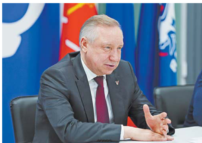
Губернатор Петербурга встретился с жителями | GOV.SPB.RU