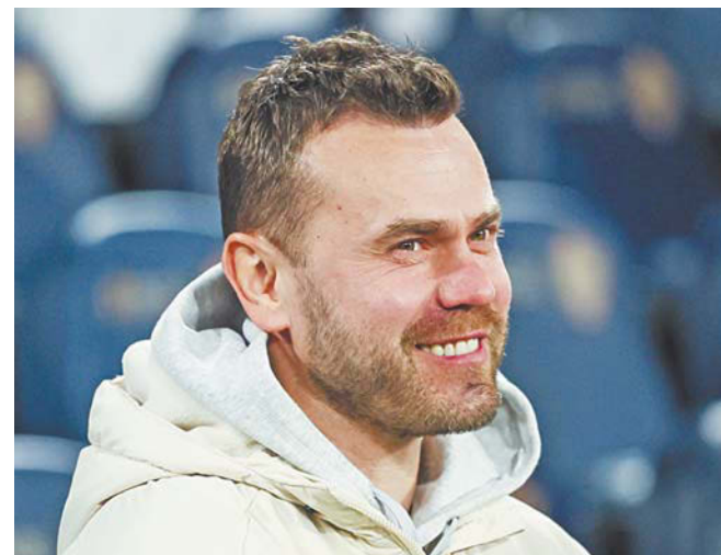
Вратарь играет за ЦСКА более 22 лет – первый официальный матч за взрослую команду он провёл аж 29 марта 2003 года

рить о том, что футбол – это всего лишь игра. А потом тебе прилетает фаер в шею или мимо головы свистит бутылка или бильярдный шар, как это было у меня в Дании, где мы играли с молодёжной сборной, – и ты запоздало понимаешь, как легко может по чьей-то глупости оборваться человеческая жизнь. Бывало ли мне страшно? Когда молод, о страхе вообще не задумываешься, тем более в игре. Когда случается травма, это куда страшнее».