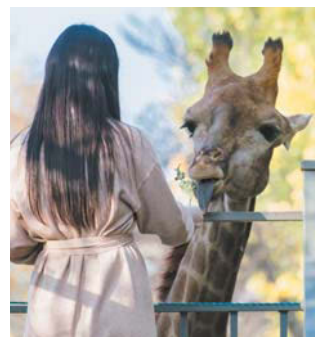
В переводе на российские рубли билет в Алматинский зоопарк обойдётся примерно в 150 рублей. Корм для животных стоит 30 рублей. Посетители могут покормить жирафа веточкой акации, а слона угостить морковкой