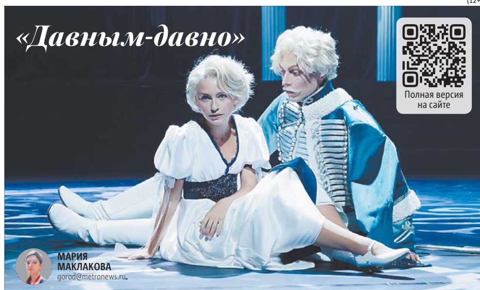
Сцена из спектакля. Больше рецензий – на metronews.ru