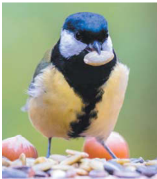
Синиц следует кормить сырыми семечками и арахисом. Зимой рекомендуется приносить несолёное сало

– Синичники строятся по тому же принципу, что и скворечники, – комментирует биолог. – Только они меньше. Главной особенностью искусственного гнезда для мелких птиц является размер леткового отверстия, он должен быть 3 см в диаметре.