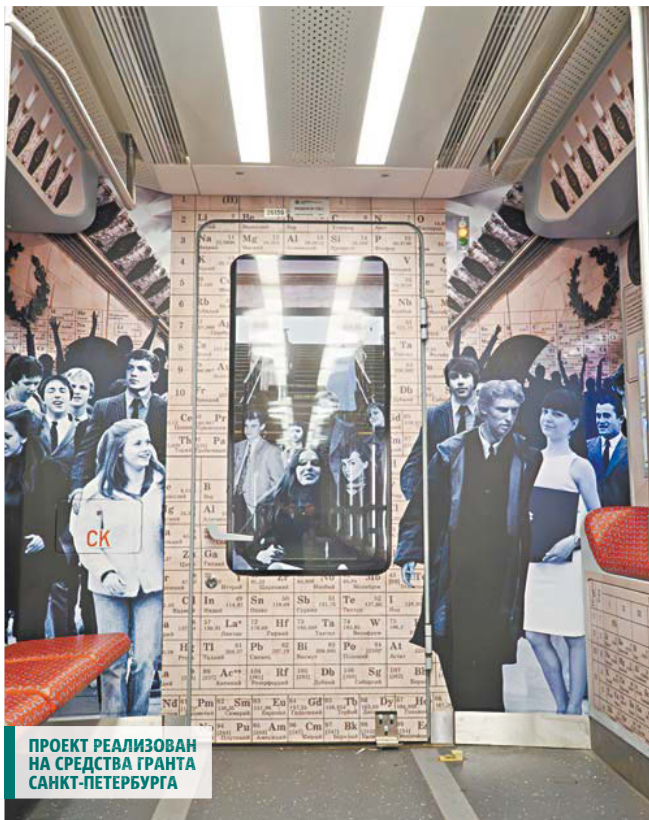
ПРОЕКТ РЕАЛИЗОВАН НА СРЕДСТВА ГРАНТА САНКТ-ПЕТЕРБУРГА

Брендируемый состав в честь 70-летия метрополитена