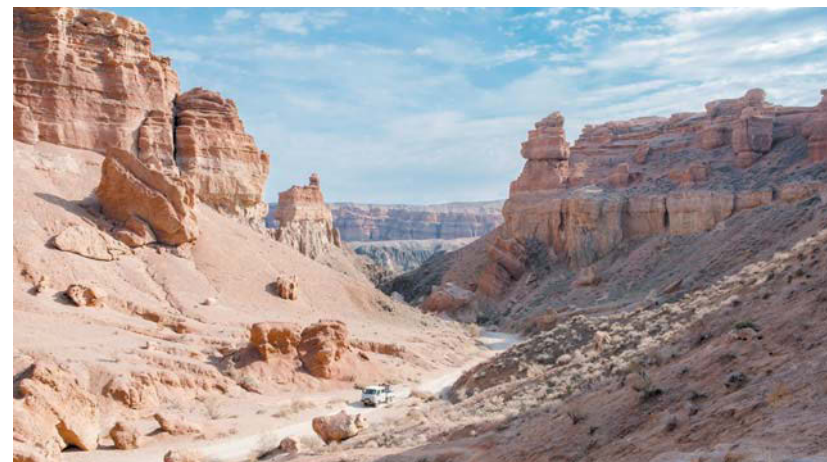
Долина замков в Чарынском каньоне – одно из самых привлекательных и доступных туристических мест в Казахстане

Казахстан – одна из немногих стран, куда российский турист может попасть по внутреннему паспорту. Но есть нюанс. Если у вас нет загранника, деньги лучше поменять ещё в России. Потому что в самом Казахстане российские рубли (как и другую валюту) иностранцы могут поменять только при наличии заграничного паспорта.