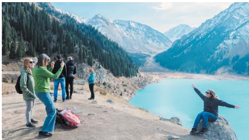
К Большому Алматинскому озеру нельзя подъехать на автотранспорте. Но ради того, чтобы увидеть изумрудную жемчужину в обрамлении гор, многие туристы готовы идти 12 км пешком

По Казахстану можно путешествовать в разное время года. Но самым комфортным и красивым временем считаются весна и осень. Metro рассказывает, что можно увидеть за несколько дней в Алматы и его окрестностях