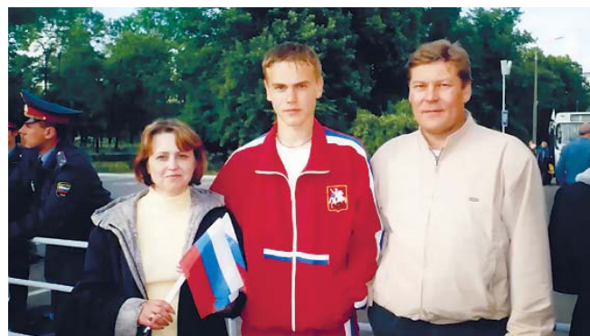
С самыми преданными болельщиками – мамой и папой

«Изнёту карьеры – интересная штука. Ты сам продолжаешь тренироваться, не делая себе никаких поблажек, по-прежнему чувствуешь каждую мышцу; так же хорошо, а возможно, даже лучше понимаешь игру, но за спиной периодически слышишь о себе: «Он уже не тот...» Поэтому сейчас многое воспринимаю просто с юмором. Кто-то считает, что я устарел? О'кей, вообще не вопрос. Матч с «Краснодаром» за Суперкубок кто выиграл? Старичок Акинфеев!»