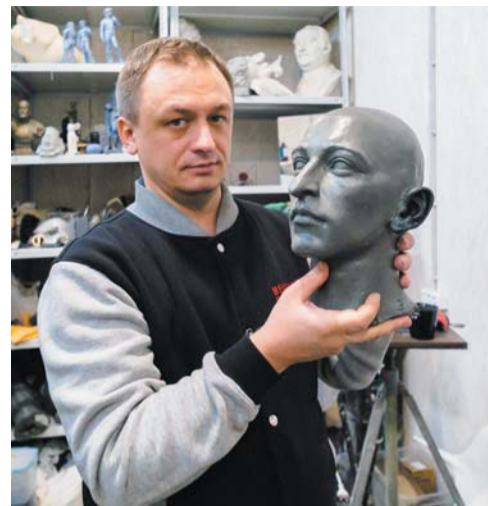
Скульптор с портретом Александра Блока. Выставочный центр и мастерские находятся в 5-м павильоне «Ленфильма»