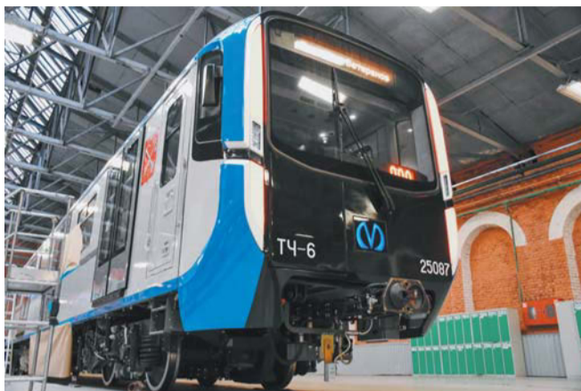
Петербургцам показали новый поезд в синей цветовой гамме

«Это последний поезд, предназначенный для 1-й линии по действующему гос-