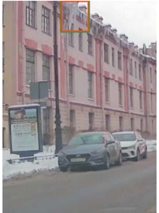
Фото, сделанные «Городовым» прошлой зимой | ПРЕСС-СЛУЖБА ГАТИ

Штраф за наледь и сосульки – 100 тыс. рублей. В случае повторной фиксации