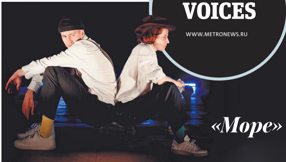
Сцена из спектакля. Больше рецензий – на metronews.ru