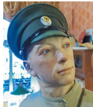
Николая Гумилёва и Анну Ахматову авторы разместили в одном зале

ем в разных ракурсах, а затем я вырезаю фигуру. Так «появились на свет» все наши знаменитости, которых можно встретить в экспозиции «Авторский стиль».