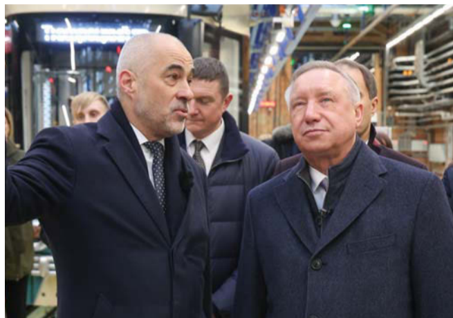
Губернатор Александр Беглов и директор СПб ГУП «Горэлектротранс» Денис Минкин осматривают депо после реконструкции