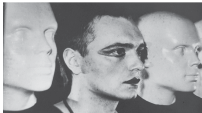
Константин Кинчев в образе манекена в группе «Стиль»

В числе лотов и культовые для многих меломанов самиздатские музыкальные журналы, такие как свердловский «Урлайт» с карикатурой на Сталина, Хрущёва и Брежнева в виде панк-музыкантов. Он издавался тиражом 100 экземпляров, и сейчас сохранилось всего лишь несколько штук. Свердловск, ныне Екатеринбург, во времена позднего СССР был второй родиной русского рока. АЛЕКСАНДР БРАТЕРСКИЙ