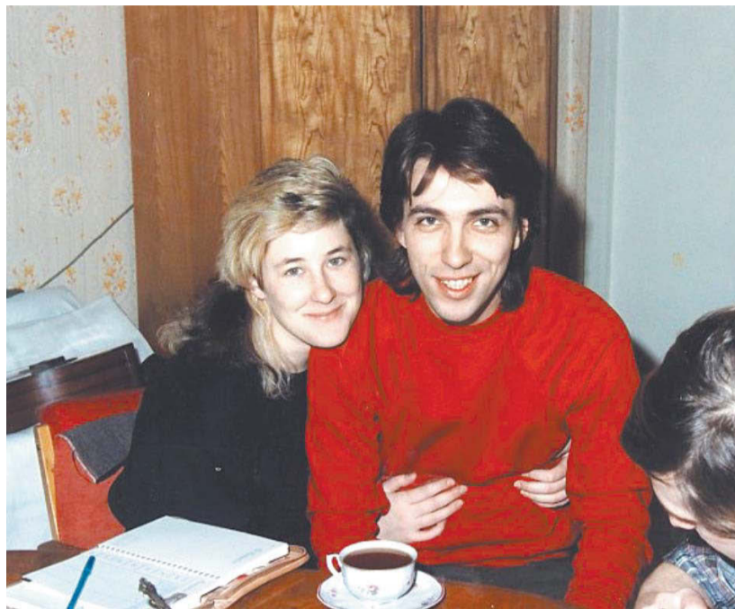
Джоанна Стингрей с музыкантом Сергеем Курёхиным

В Таврическом дворце прошёл Кадетский бал. 150 пар, состоящие из учеников профильных классов, танцевали под звуки полонеза, вальса, польки и фокстрота. Гостями мероприятия стали ребята из Мариуполя и Республики Беларусь. Бал провели в третий раз. В этом году он был посвящён 325-летию кадетского образования в России. В Петербурге открыто 346 кадетских классов в 69 школах, где обучается порядка 9000 человек. Всего есть 12 направлений – это МЧС, морское дело, авиация, военная медицина.