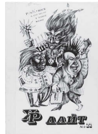
Обложка журнала «Урлайт»