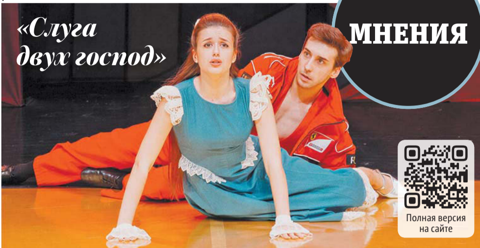
«Слуга двух господ»