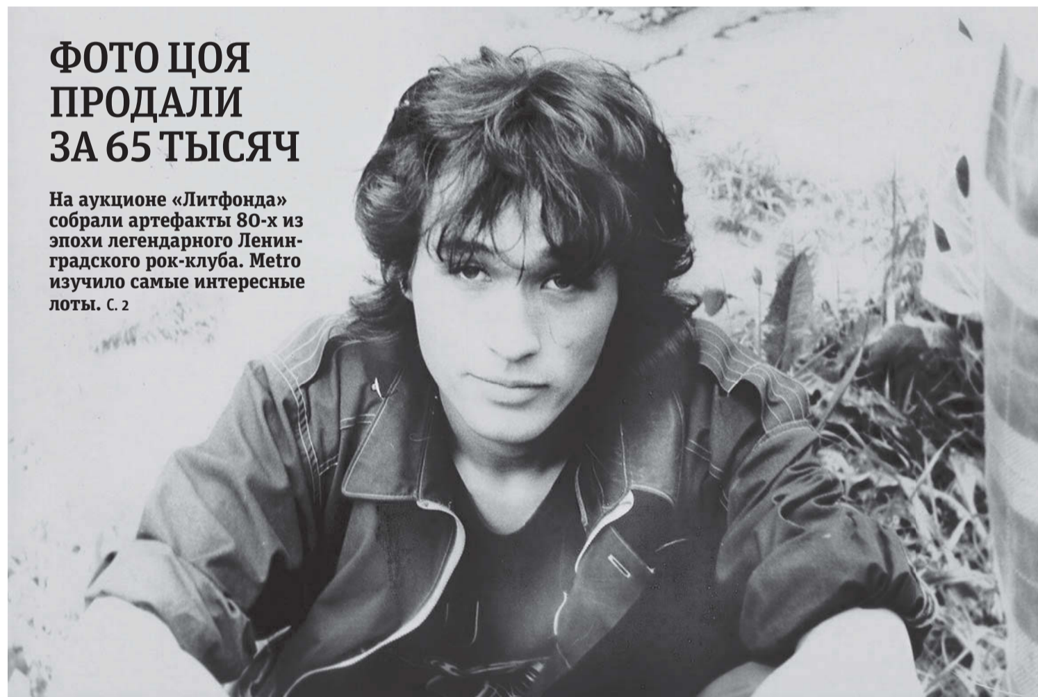
ФОТО ЦОЯ ПРОДАЛИ ЗА 65 ТЫСЯЧ

Газета Metro и Театр-фестиваль «Балтийский дом» подвели итоги конкурса, приуроченного к премьере спектакля «Про любовь». Участникам удалось зарифмовать свои чувства и истории отношений в «104 словах о любви». с.4