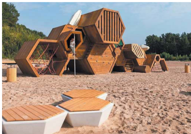
Пляж Дюны | ВСЕ ФОТО: GOV.SPB.RU, @A_BEGLOV

Их создают благодаря программе «Формирование комфортной городской среды» и инициативам жителей. Только в 2025 году в разных районах города обору́довали 46 таких площадок. Горожане также могут предложить территории для благоустройства. Сделать это возможно до 26 марта на сайте: zagorodsreda.gosuslugi.ru .