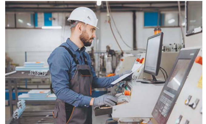
В Петербурге зарплаты у наладчиков станков с ЧПУ доходят до 250 тыс. рублей

Конкуренция за квалифицированных коммерсантов, способных работать в новых экономических условиях, крайне высока. Это те люди, которые приносят деньги в компанию здесь и сейчас. Наблюдается критический де-