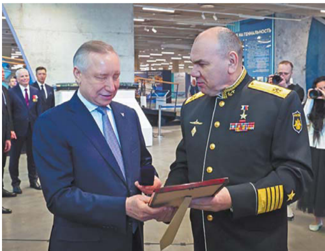
На мероприятии в Музее военно-морской славы России в Кронштадте побывал Александр Беглов | GOV.SPB.RU