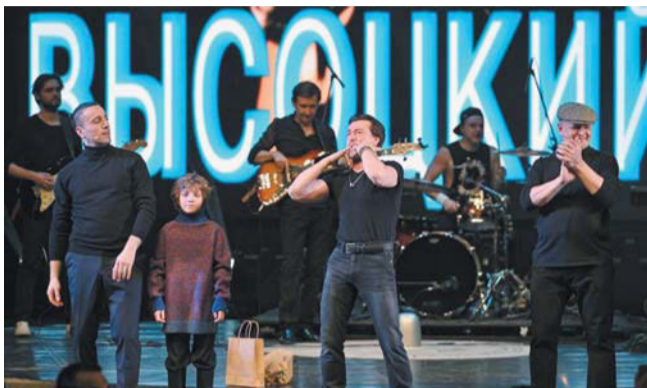
«Высоцкий. Рождение легенды»

ных чартов, но мы, живущие в эпоху великих и бесконечных сравнений, конечно же, обречены сравнивать и выбирать. В Петрикирхе горожанам предлагают необычный музыкальный формат. На этот раз вниманию публики будут представлены 10, возможно, величайших органных произведений всех времён. Всё в мире субъективно, но организаторы составили программу таким образом, что популярность произведений не являлась единственным критерием «отбора», хотя однозначно – каждое из сочинений в своем роде уникальное.