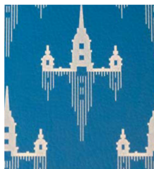
Петропавловская крепость изображена на сиденьях в вагонах новых поездов

Юные исследователи метро вошли в третий вагон – именно в нём в тестовом режиме работают два медиаэкрана. Они встроены в оконные проёмы. Информация на экранах меняется в зависимости от местополо-