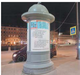
Выбранные цитаты появились на афишах

ва. Также в числе победителей цитаты Резо Габриадзе, Кирилла Лаврова, Евгения Леонова, Всеволода Мейерхольда, Андрея Могучего, Славомира Мрожека, Алисы Фрейндлих, Карела Чапека.