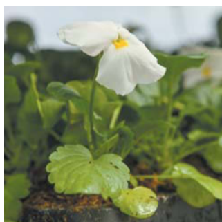
Петербургские садовники отдадут «зелёным» подопечным всю душу

– В связи с тем, что год объявлен Годом единства народов России, мы тематиче-