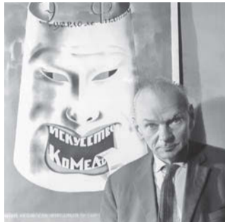
Режиссёр и художник Николай Акимов

украшены афишами к спектаклям Театра комедии.