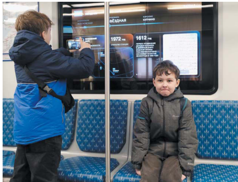
Информация на экране меняется в зависимости от местоположения поезда

В Северной столице продолжается Неделя здоровья матери и ребёнка, в рамках которой сегодня, 2 апреля, петербурженки могут принять участие в акции «Репродуктивный чекап». Она пройдёт в ТРЦ на ул. Фучика, 2. Там женщины до 40 лет смогут бесплатно пройти УЗИ молочных желёз и получить консультацию акушера-гинеколога. В Музее гигиены до 3 апреля идут экскурсии о сохранении репродуктивного здоровья. Гиды рассказывают о диагностике здоровья новорождённых и методах помощи при бесплодии.