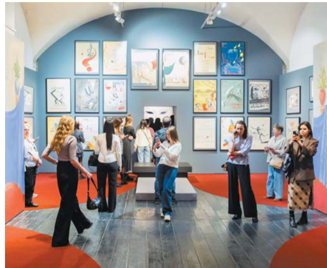
Сценографии режиссёра посвящено всё пространство первого этажа музея

– Это художественные мемуары эпохи, – комментирует Екатерина Маршалл. – В галерее собраны портреты людей, с которыми Акимов работал и дружил. Конечно, он не мог