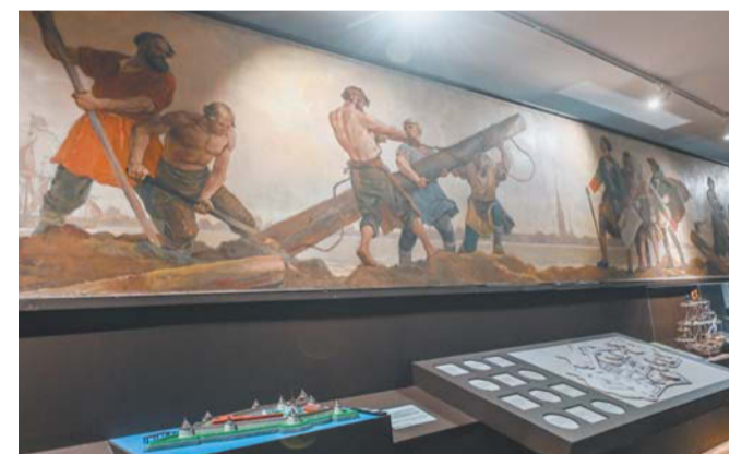
«Закладка Петербурга» (1946–1947, Серова В.А. и Кочергина Н.М.) | ФОТО: МЕТРО | ИГОРЬ АКИМОВ