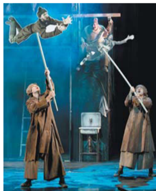
Фестиваль завершится спектаклем «Господа Головлёвы» (Казахстан)

В день открытия зрители увидят два спектакля из Бишкека (Кыргызстан). На большой сцене театра покажут спектакль «Дядюшкин сон» (18+) Городского драматического театра им. А. Умуралиева по произведению Ф.М.