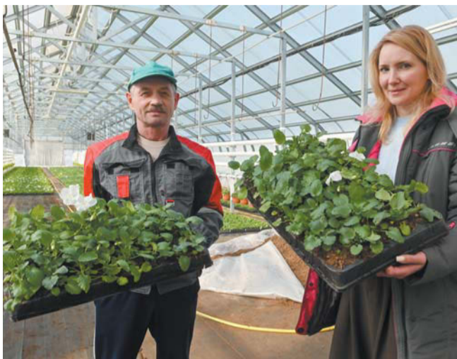
Виолы уже покрываются первыми цветами, и их переместили в более прохладные оранжереи

К весенне-летнему сезону в калининских оранжереях вырастят более полумиллиона растений. Тысячи зелёных ростков сейчас тянутся к стеклянному потолку. Это