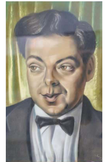
Портрет Аркадия Райкина, написанный Николаем Акимовым

обойти вниманием знаменитого актёра Сергея Филиппова, хотя сам говорил, что звёзды театру мешают: они слишком много внимания оттягивают на себя. Дружил с Михаилом Зощенко. Когда писатель остался без работы, помогал ему, давал заказы на переводы. Для Аркадия Райкина Акимов поставил мини-спектакль «На сон грянувший», в котором за 12 минут действия актёр сыграл девять персонажей. С драматургом Володиным режиссёр дружил много лет, собирался ставить его пьесу «Назначение», но что-то не сложилось. Много общался с Сергеем Михалковым, правда, его пьесу «Памятник» в своём театре ставить отказался.