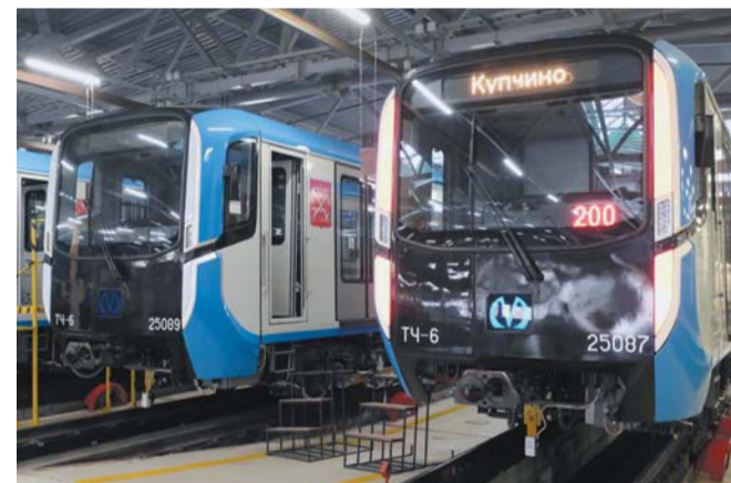
Новые «Балтийцы» курсируют от «Парнаса» до «Купчино» и обратно