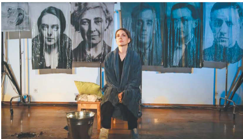
Русский театр в Белграде покажет спектакль «Ариадна Эфрон: рассказанная жизнь» о дочери Марины Цветаевой