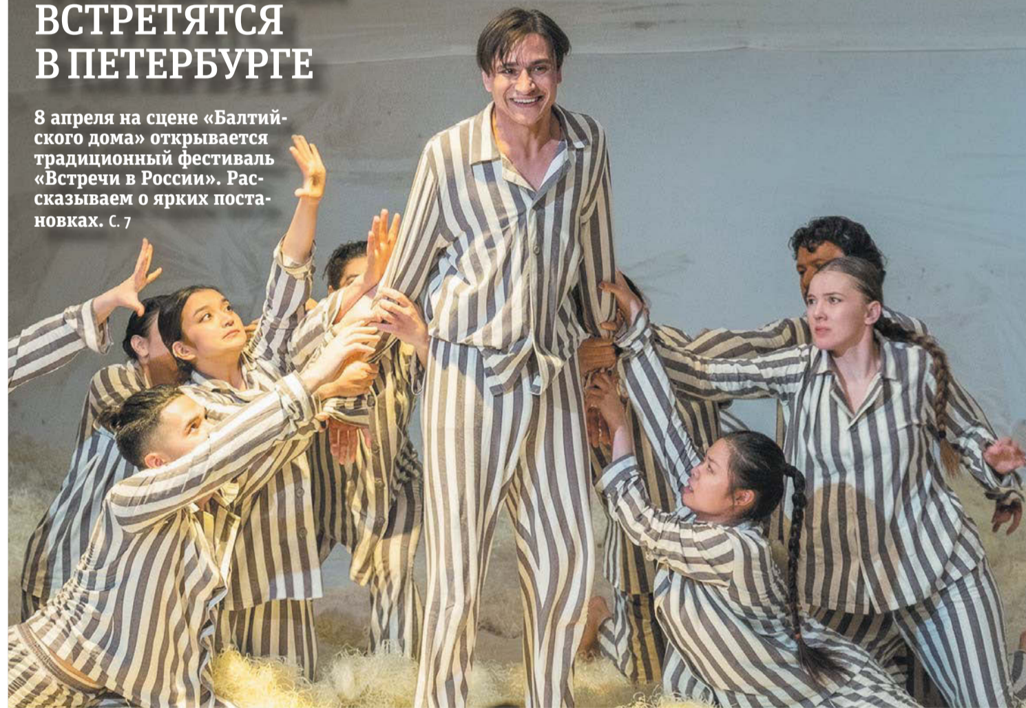
КАДР ИЗ СПЕКТАКЛЯ «ЗВЕРИНЫЕ ИСТОРИИ» ТЕАТРА-СТУДИИ «ДИЙДОР»

8 апреля на сцене «Балтийского дома» открывается традиционный фестиваль «Встречи в России». Рассказываем о ярких постановках. с. 7