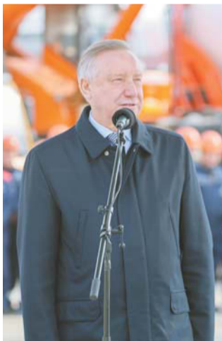
Губернатор принял участие в торжественном мероприятии | GOV.SPB.RU

Первый участок ШМСД открыли для автомобилистов в 2024 году. Это Витебская развязка. METRO