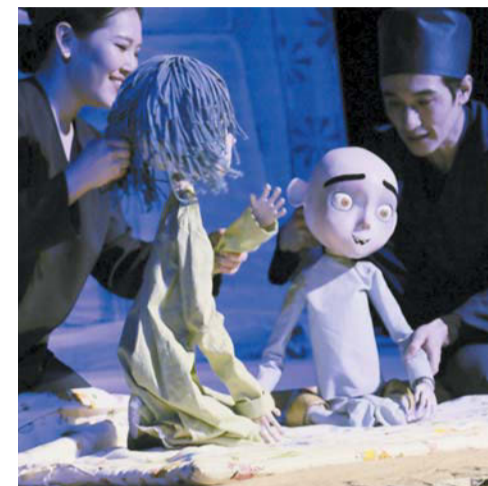
Сцена из спектакля «Письма-самолётики» (Кыргызстан)

Завершится фестиваль спектаклем «Господа Головлёвы» (16+) по роману М.Е. Салтыкова-Щедрина Национального русского театра драмы имени Михаила Лермонтова (Алматы, Казахстан)