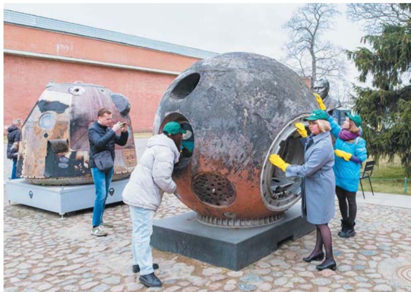
Поверхность спускаемых аппаратов мы обработали сухими губками, а Гагарина, Королёва и Глушко помыли чистой водой