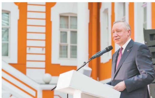
Губернатор рассказал о новой экспозиции Археологического музея