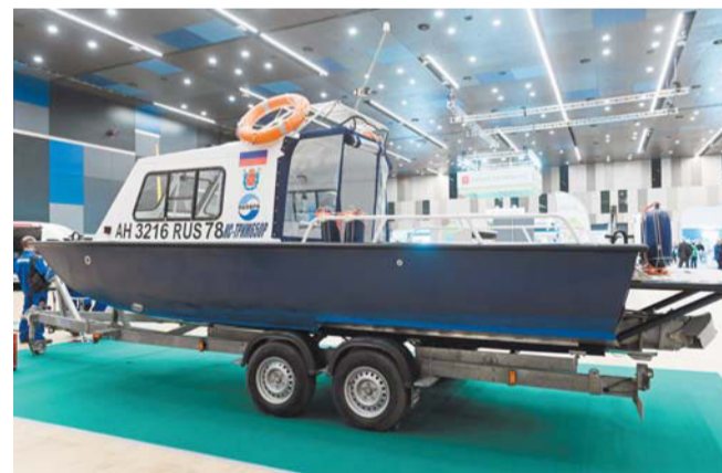
Компактный патрульный катер для мониторинга ситуаций на воде

щади вручали МЧС города. Он предназначен для пожаротушения и спасения людей. Существуют объекты на воде – нефтяные вышки, например, или другие зоны, которые могут гореть. На автомобиле до них не доберёшься. Может воспламениться катер или корабль, и это нужно тушить. Кроме того, иногда бывают ситуации, когда горят леса, и машина тоже не может проехать. У пожарного катера есть ровная большая кормовая площадка, которая позволяет во время спасательных операций вывозить большое количество людей, – говорит собеседник Metro.