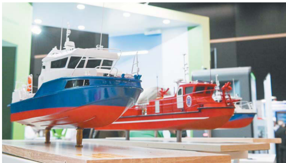
Мини-модели катеров, которые есть в составе природоохранного флота Петербурга

– Основная задача разведного патрульного катера – мониторинг на воде. Браконьерство – несанкционированная ловля рыбы, изучение состояния гидротехнических сооружений – появились ли где-то трещины, – объясняет представитель завода.