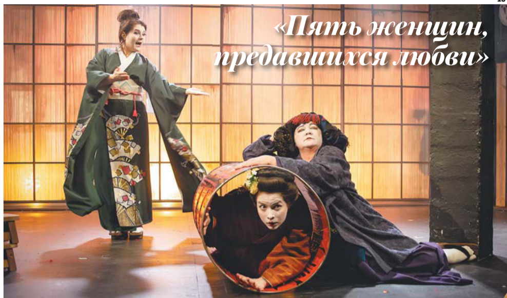
«Пять женщин, предавшихся любви»