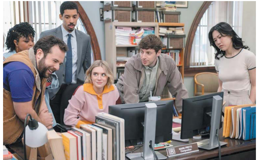
Офисная жизнь для поколения Z превратилась в поле битвы за личные границы и удобное кресло

Она не видит смысла в присутствии, если все зада- чи можно решить из дома.