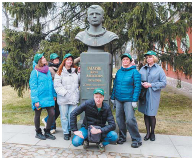
Редакция Metro и чистый бюст Юрия Гагарина

Оба дня вход в Музей космонавтики и ракетной техники имени В.П. Глушко станет свободным для всех посетителей.