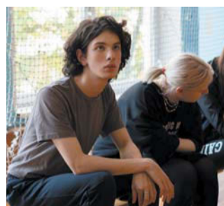
КАДР ИЗ СЕРИАЛА

В 2021 году вышел альманах короткометражек о подростках «Шестнадцать+». Главными героями десяти новеллы «Я не боюсь» стали Марк Эйдельштейн и Илларион Маров. В том же году снялся в драме «Первый снег» вместе с Аней Пересильд.