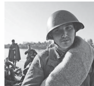
Участник реконструкции «Невский пятачок»