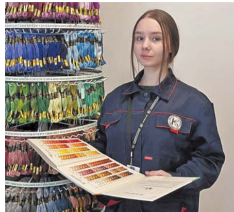
Трудовая династия из Петербурга «плетёт» семейную историю из ниток мулине

– Дома за чашкой чая говорим про нитки мулине, вышивку, технологии и. Сейчас швейные машинки уже другие – высокоскоростные. Соответственно, под эти задачи должны быть и нитки новые, чтобы они летали на тех же скоростях, – делится с журналистом Metro петербурженка.