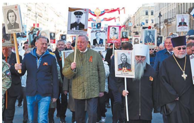
«Бессмертный полк» в 2025 году. Губернатор Александр Беглов возглавил шествие | GOV.SPb.RU