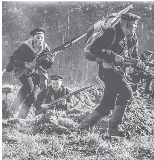
Фестиваль военно-исторической реконструкции «Красногвардейский рубеж»

В преддверии 81-й годовщины Победы в Великой Отечественной войне на месте строительства Южной широтной магистрали прошла эколого-патриотическая акция «Аллея Памяти». Члены городского правительства, представители дорожных организаций и поисковых отрядов продолжили традицию, заложенную годом ранее: на рубеже обороны Ленинграда высадили ещё 50 яблонь. Теперь аллея насчитывает 93 дерева. «Южная широтная магистраль – это не только современная дорога, которая улучшит транспортную доступность целого района. Это место, хранящее память о подвиге советского солдата. Строительство не стирает историю – наоборот, оно даёт нам возможность сделать её более зримой для людей, которые будут проезжать здесь каждый день», – отметил губернатор Александр Беглов.