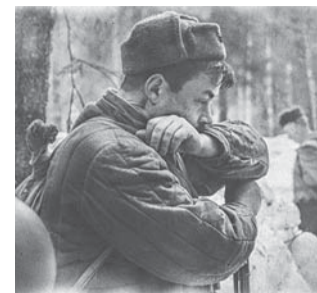
Участник реконструкции боёв в Карелии 1944 года