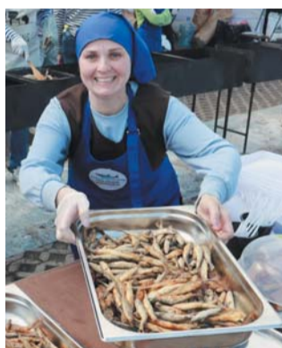
Праздник корюшки | ПРЕДСТАВЛЕНО ОРГАНИЗАТОРАМИ

На новой сцене Мариинского театра будут представлены пронзительные одноактные балеты «Барышня и хулиган» и «Ленинградская симфония» на музыку Шостаковича, которые показывают в самые важные и