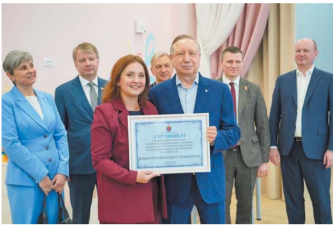
Детскому саду №30 вручили сертификат на приобретение робототехнического комплекта | @A_BEGLOV