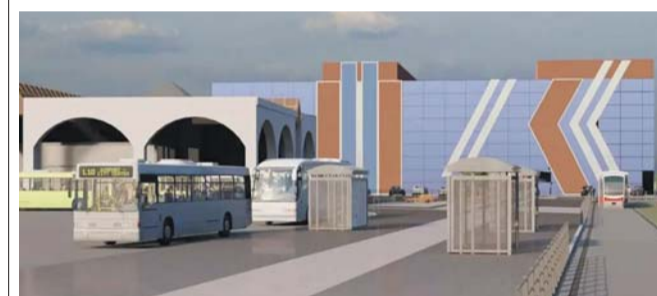
Работы ведутся по программе «Формирование комфортной городской среды»