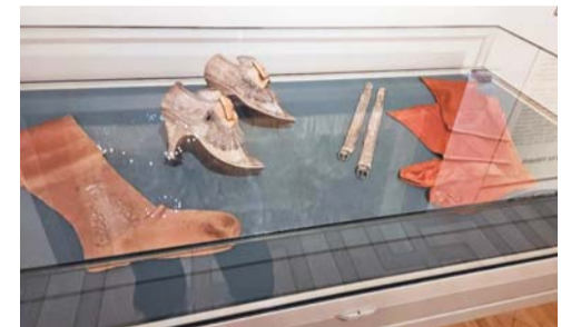
Туфли и чулки от коронационного костюма императрицы Екатерины Первой | ЕВГЕНИЯ НАЗАРОВА