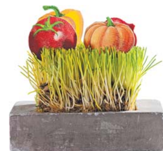
Так выглядят блюда у шефа

Да, мода на еду есть, и она всегда была. Сейчас, на мой взгляд, она сильно сместилась в сторону понятной и простой еды. Без перегруза, без лишней сложности, с акцентом на продукт. Но при этом это не отменяет спрос на эмоции.