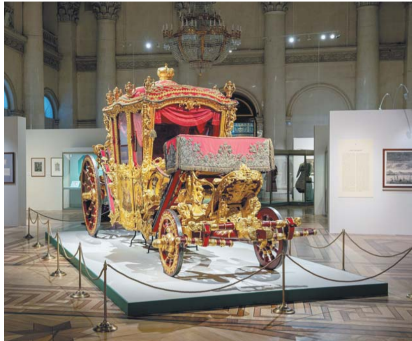
Коронационная карета | АЛЕКСЕЙ БРОННИКОВ, ГОСУДАРСТВЕННЫЙ ЭРМИТАЖ

Завершилось голосование за самый чистый район по результатам уборки во время весеннего месячника по благоустройству. Выбор жители осуществляли онлайн, по пятибалльной шкале оценивали состояние территорий в комплексе – улиц, зелёных зон, дворов, фасадов многоквартирных домов, маршрутов к магазинам и социальным объектам и т. д. В этом году победителями стали Кировский, Курортный и Калининский районы, хотя отметим, что они лишь с небольшим отрывом опередили Московский, Красногвардейский и Красносельский. Кстати, Курортный уже третий сезон оказывается среди лидеров.