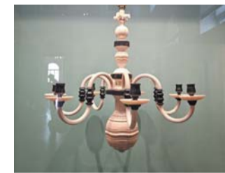
Паникадило

Посетители увидят гравюры, иконы, портреты, европейские ткани, фарфор, мебель и аксессуары, в том числе приобретённые Екатериной I во время путешествий по Европе.