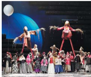
«Снегурочка» | МАРИИНСКИЙ ТЕАТР | 2022