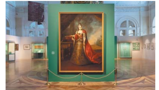
Екатерина Первая | АЛЕКСЕЙ БРОННИКОВ, ГОСУДАРСТВЕННЫЙ ЭРМИТАЖ